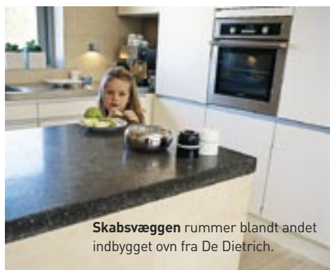
Skabsvæggen rummer blandt andet indbygget ovn fra De Dietrich.