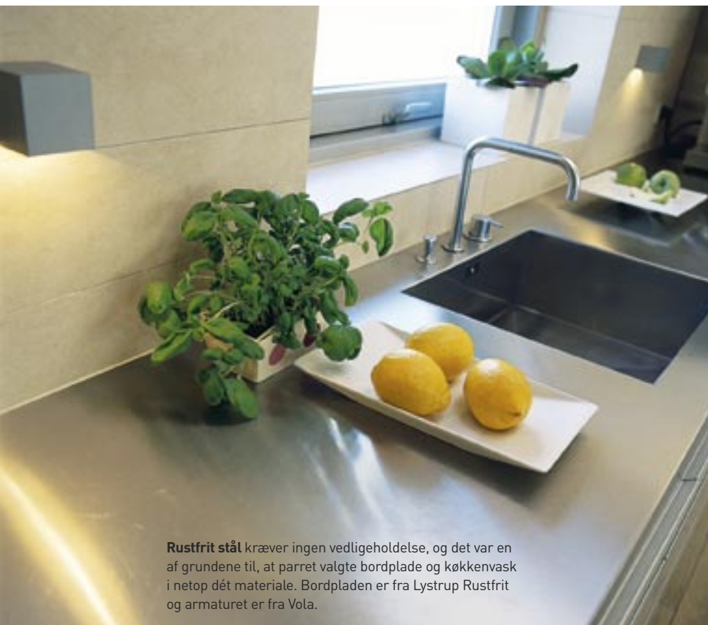
Rustfrit stål kræver ingen vedligeholdelse, og det var en af grundene til, at parret valgte bordplade og køkkenskiv i netop dét materiale. Bordpladen er fra Lystrup Rustfrit og armaturet er fra Vola.

Skjult , men lettilgængelig. Ideen til nichen opstod, fordi parret ville have så meget som muligt gemt væk og alligevel have mulighed for at komme nemt til visse ting. Først stod brødristeren her. Nu har espressomaskinen fra Innova indtaget pladsen.