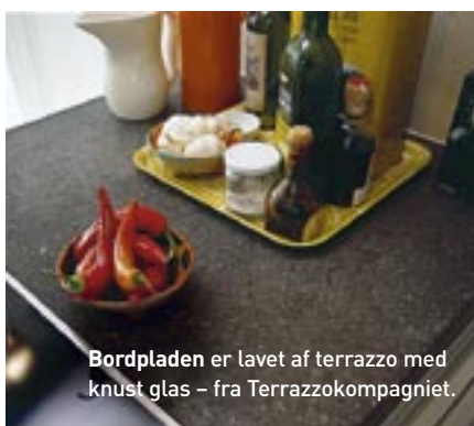
Bordpladen er lavet af terrazzo med knust glas – fra Terrazzokompagniet.